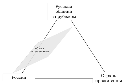
Рис. 1. Система взаимодействий при реализации политики в отношении соотечественников, проживающих за рубежом

Результаты исследования и обсуждение. Анализируя полученные результаты, необходимо отметить, что фактически при реализации государственной политики в отношении российских соотечественников мы имеем дело с системой взаимодействий, построенных по типу треугольника, в вершинах которого находятся соответственно русская община, Россия и страна проживания (рис. 1).